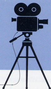
BILD- UND TONAUFNAHMEN

Wir weisen ausdrücklich darauf hin, dass im Rahmen unseres Abschlusskonzertes am 18. Dezember 2016 Bild- und Tonmaterial in Form von Fotos und Videoaufzeichnungen durch von uns beauftragte, akkreditierte Personen und Dienstleister erstellt wird.